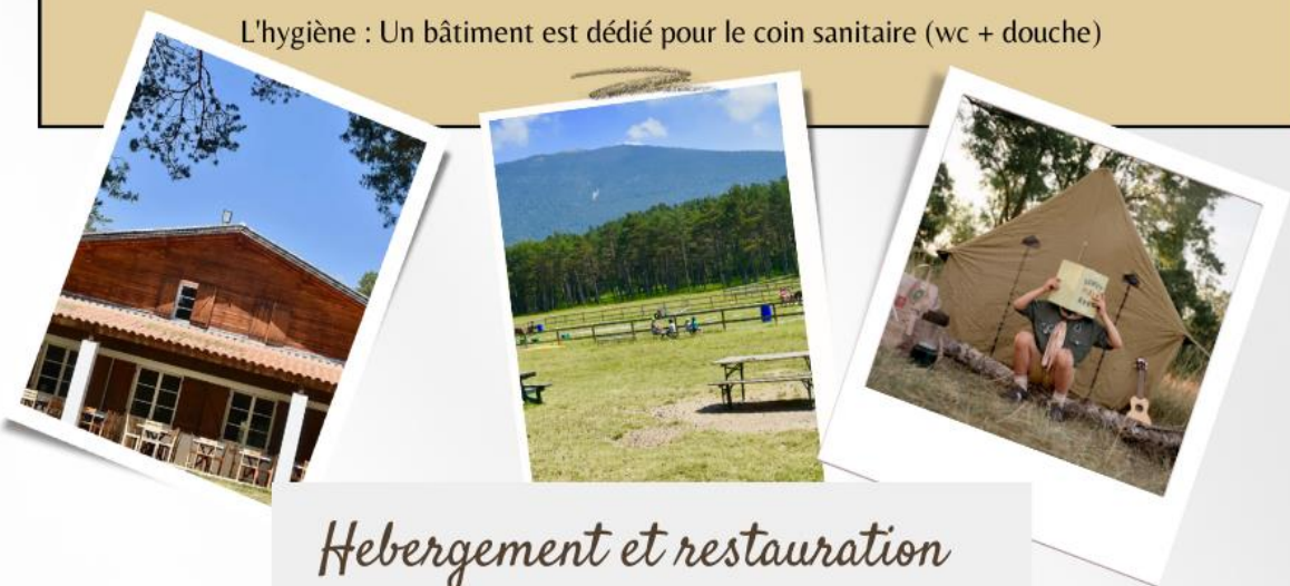
Hébergement et restauration

L'hygiène : Un bâtiment est dédié pour le coin sanitaire (wc + douche)